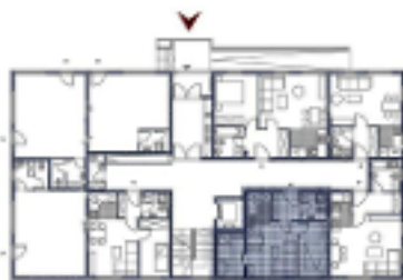
Grundriss Stockwerk EG