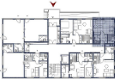
Grundriss Stockwerk EG