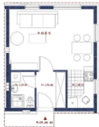
osnova stana m 1:75